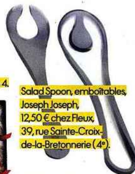
Salad Spoon, emboîtées, Joseph Joseph, 12,50 € chez Fleux, 39, rue Sainte-Croix- de-la-Bretonnerie (4 e ).