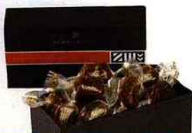
Caramels au beurre salé, Henri Le Roux, 1, rue Bourbon-le-Château (6 e ), 17,50 € les 250 g.