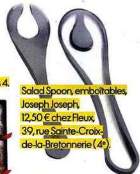
Salad Spoon, emboîtées, Joseph Joseph, 12,50 € chez Fleux, 39, rue Sainte-Croix- de-la-Bretonnerie (4 e ).