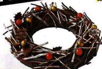
Glace couronne 6/8 personnes, A la Mère de famille, 35, rue du Faubourg-Montmartre (9 e ), 44 €.