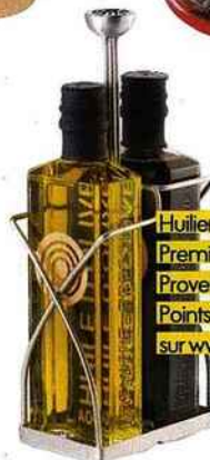
Huilière et vinaigrier, Première Pression Provence, 34 €. Points de vente sur www.ppprovence.com