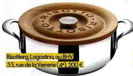
Risottiera, Lagostina, au BHV 55, rue de la Verrière (4 e ), 200 €.