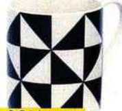
Mug, 3 €, Monoprix, www.monoprix.fr