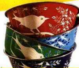
Bois émaillés, peints à la main, Amnesty international, 72, bd de la Villette (19 e ), 29 € les 4.