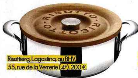
Risottiera, Lagostina, au BHV 55, rue de la Verrière (4 e ), 200 €.