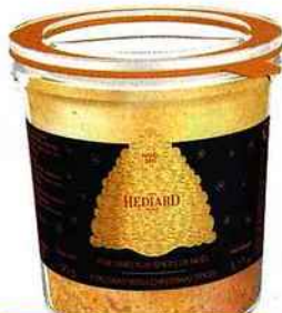
Foie gras aux épices Hédiard, 21, pl. de la Madeleine (8 e ), 90 g, 19 €.