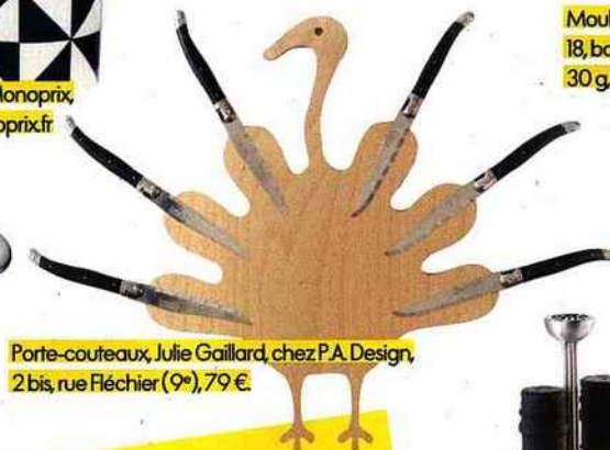
Porte-couteaux, Julie Gaillard, chez P.A. Design, 2 bis, rue Fléchier (9 e ), 79 €.