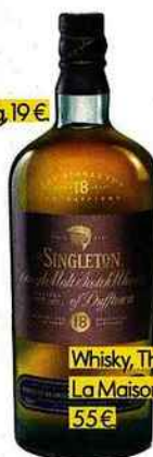
Whisky, The Singleton of Dufftown 18 ans, La Maison du Whisky, 20, rue d'Anjou (8 e ), 55 €.