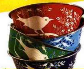
Bois émaillés, peints à la main, Amnesty international, 72, bd de la Villette (19 e ), 29 € les 4.