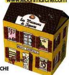
Macarons Charaix, 6,50 €, Le Bon Marché, www.lebonmarche.com