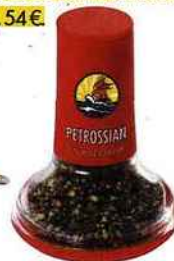
Moulin à caviar, Petrossian, 18, bd de La Tour-Maubourg (7 e ), 30 g, 54 €.