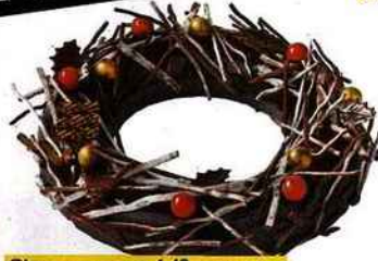
Glace couronne 6/8 personnes, A la Mère de famille, 35, rue du Faubourg-Montmartre (9 e ), 44 €.