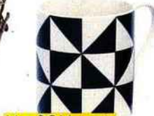
Mug, 3 €, Monoprix, www.monoprix.fr