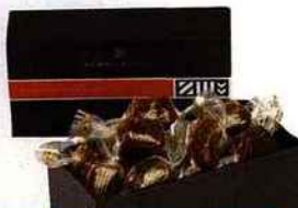
Caramels au beurre salé, Henri Le Roux, 1, rue Bourbon-le-Château (6 e ), 17,50 € les 250 g.

LE NOËL DES FOODISTAS Notre sélection pour combler tous les appétits des gourmets !