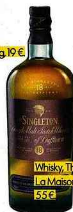
Whisky, The Singleton of Dufftown 18 ans, La Maison du Whisky, 20, rue d'Anjou (8 e ), 55 €.