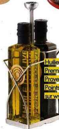
Huilière et vinaigrier, Première Pression Provence, 34 €. Points de vente sur www.ppprovence.com