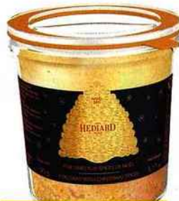
Foie gras aux épices Hédiard, 21, pl. de la Madeleine (8 e ), 90 g, 19 €.