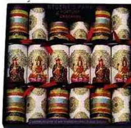
Fortune crackers Regent's Park, 19,90 €, Monoprix.