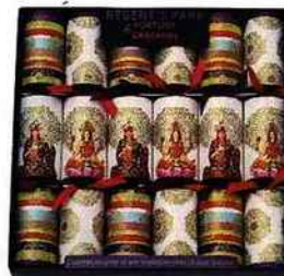
Fortune crackers Regent's Park, 19,90 €, Monoprix.