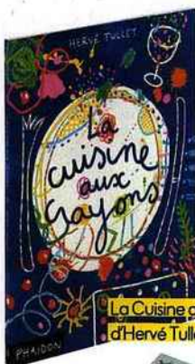
La Cuisine aux crayons, d'Hervé Tullet, éd. Phaidon, 9,95 €.