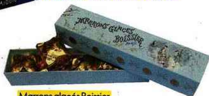
Marrons glacés Boissier, 184, av. Victor-Hugo (16 e ), 17 € les 285 g.